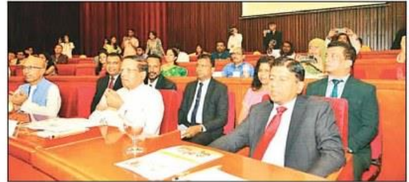
दीप प्रज्वलन के साथ फैस्ट को शुरू करते हुए तथा (दाएं) फैस्ट में उपस्थित अतिथि।

फैस्ट में 15 देशों के 200 से अधिक युवा लेंगे हिस्सा